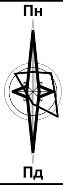
Схема розташування території детального плану території в системі планувальної структури населеного пункту

Викопіювання з Детального плану частини території в с. В. Добронь по вул. Роттаг в межах прилеглих вулиць Чонгорська та Ердехіватал